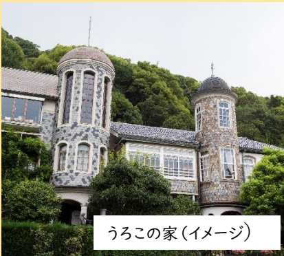
うろこの家(イメージ)