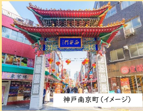
神戸南京町(イメージ)